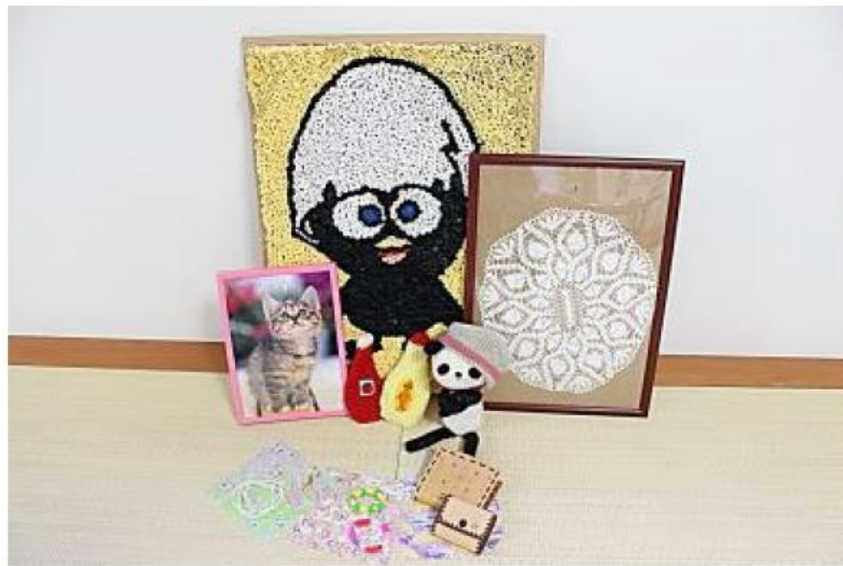
患者さまの作品です。

佐潟荘の外来 OT の大きな特徴としては、外来 OT の指定の曜日を設けることなく、月曜日～金曜日まで幅広く活動を開放することで対象者の生活リズムに合わせた選択が可能な点が挙げられます。さらに、若い方に対しては手厚く体育館を完備し体を思い切り動かすこともできる点も挙げられます。参加をするにあたり主治医と作業療法士と連携を図り治療を進めていくので、興味のある方は、ぜひ主治医へ相談をしてみてください。