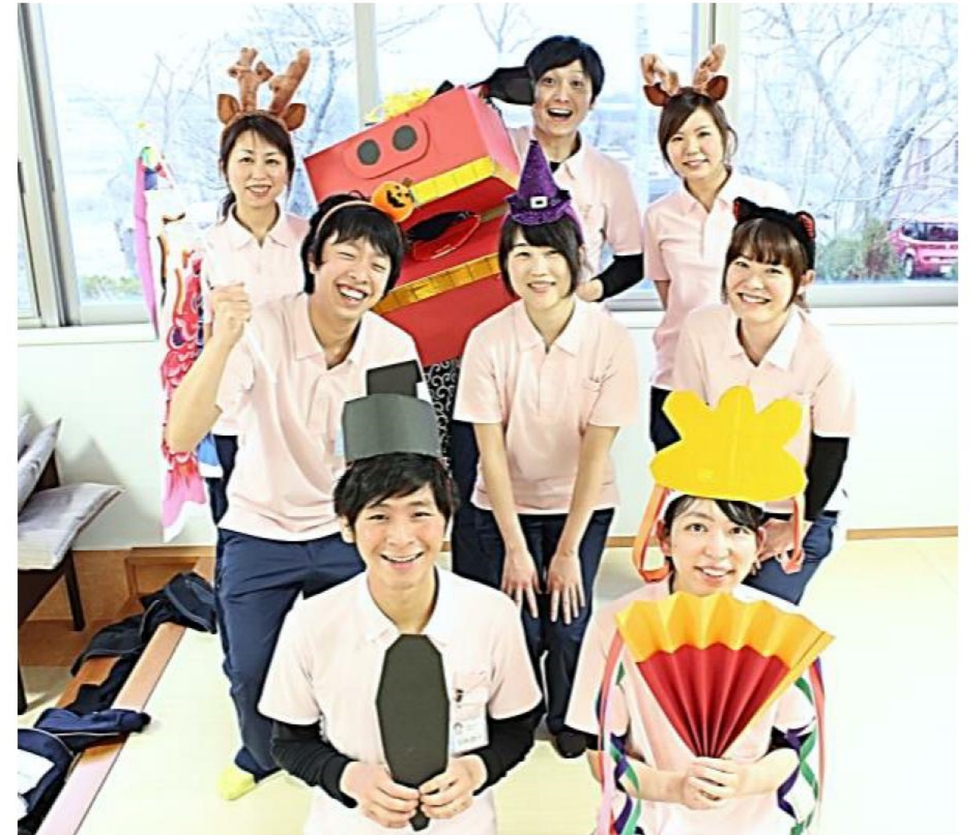
私達、作業療法士が笑顔でサポートします。

精神科の治療は「薬物療法」「精神療法」「リハビリテーション」の三本柱で成り立っています。今回ご紹介する「作業療法」はこの中の「リハビリテーション」に当たる治療方法です。具体的に「作業療法(以下 OT)」とは様々な活動、例えば手芸やレクリエーション、スポーツ等を通じて精神の安定を図る役割を果たします。さらに活動を通して、日常生活リズムの改善や集団の中で人との関わりを学び、社会参加に向けた準備をすることを目的としています。佐潟荘の外来 OT では、上記で話した大きな目的の他に「楽しむ」ということを大切に考えています。すべての精神障がい者に当てはまることではありませんが、障がいによって生活に支障をきたすと、今まで出来ていた趣味や気分転換にまで意識を向けることが出来なくなるということが多くみられます。加えて、今まで趣味が見つけれなかったという方に対しては私たち作業療法士は「楽しみ」を提供し、趣味の探索や再獲得のお手伝いを通して生活にメリハリをつけながら治療を進めていくことに重点を置いています。