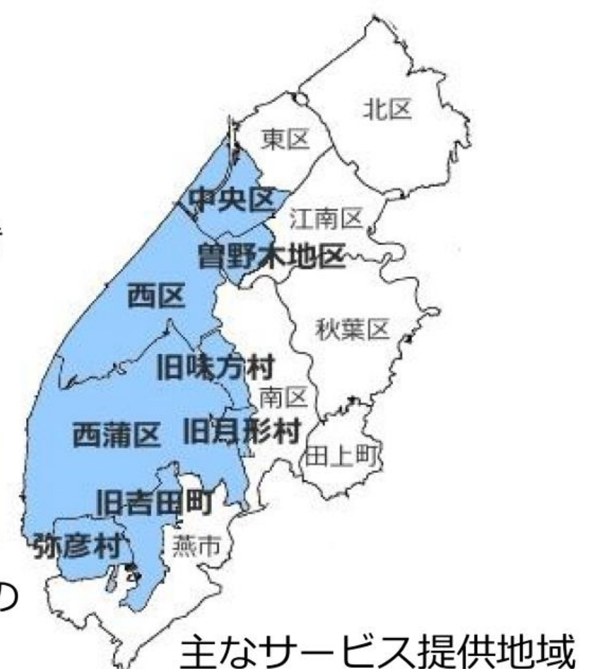
主なサービス提供地域